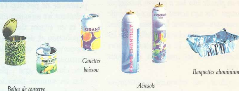
Boîtes de conserve