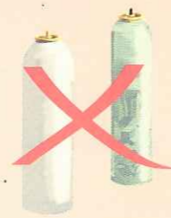
Aérosols ayant contenu des produits toxiques