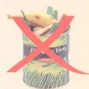
Boîtes de conserve sales