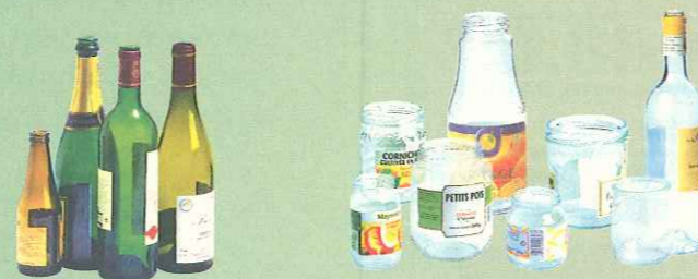
Pots, bocaux, bouteilles...