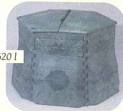
bac 620 l

Pour commander ou vous renseigner, vous pouvez contacter le VALTOM au 04.73.44.24.24.