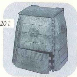
bac 320 l