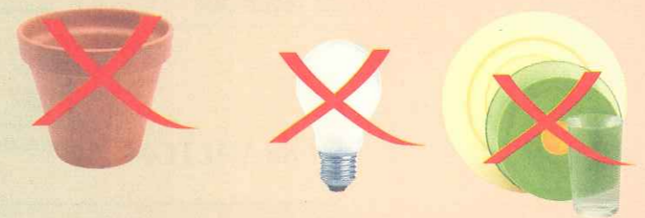
Porcelaine, faïence, ampoules, ...