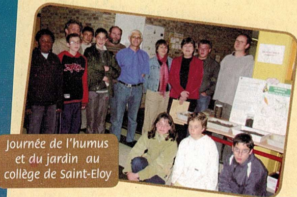
Journée de l'humus et du jardin au collège de Saint-Eloy

3- Les élèves du primaire ont participé à l'opération Brikkado : tri des briques alimentaires au profit des actions humanitaires de l'UNICEF et ont travaillé à un projet pédagogique « ramassons nos déchets » qui consiste à faire la chasse aux déchets jetés sur la voie publique.