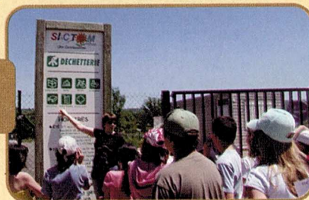
Ecole primaire de Pionsat en visite à la déchèterie